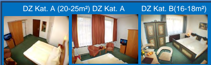
DZ Kat. A (20-25m²) DZ Kat. A DZ Kat. B(16-18m²)