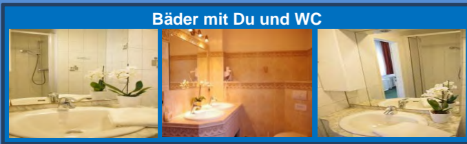
Bäder mit Du und WC