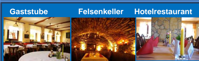
Gaststube Felsenkeller Hotelrestaurant