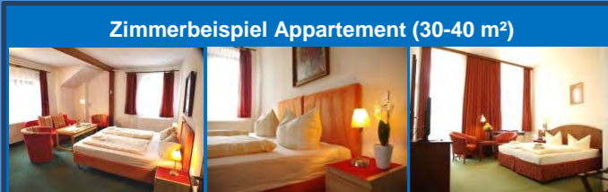
Zimmerbeispiel Appartement (30-40 m²)