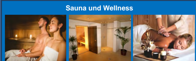
Sauna und Wellness